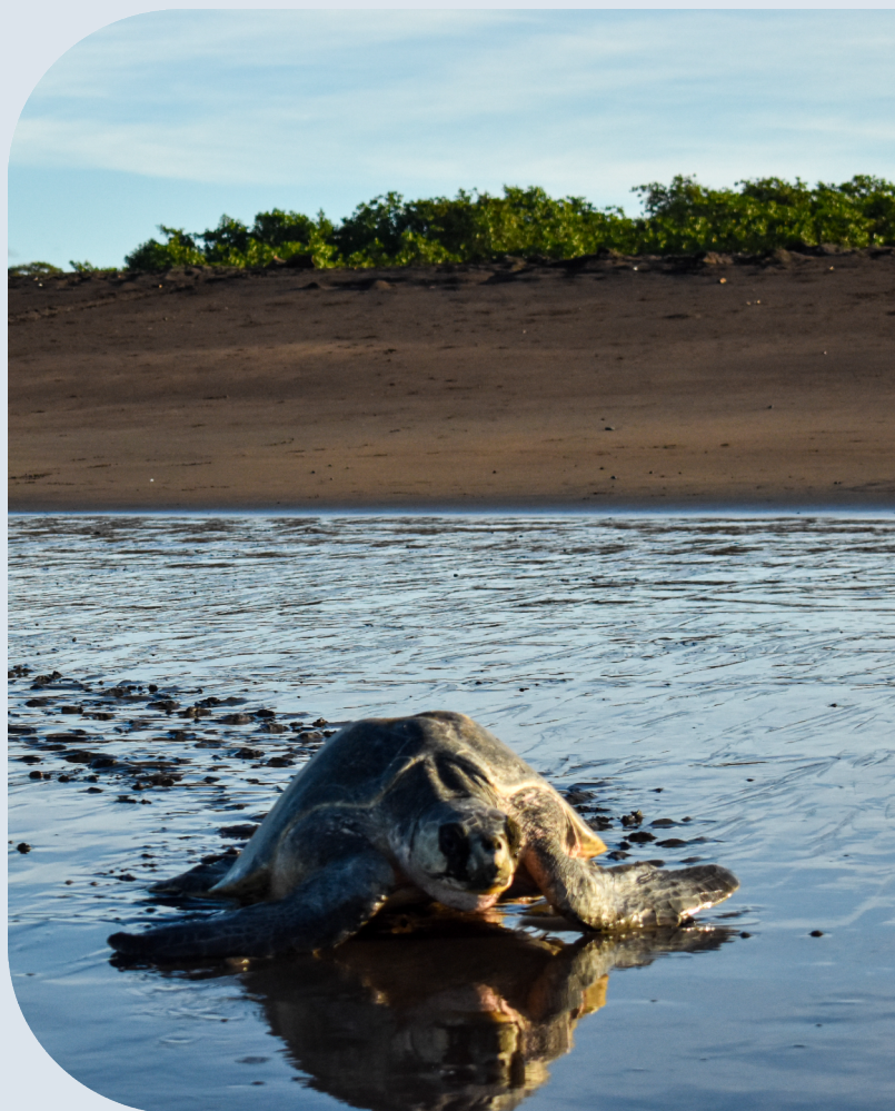
Tortuga marina ( Lepidochelys olivacea ). Fotografía: Mike Mongeau.