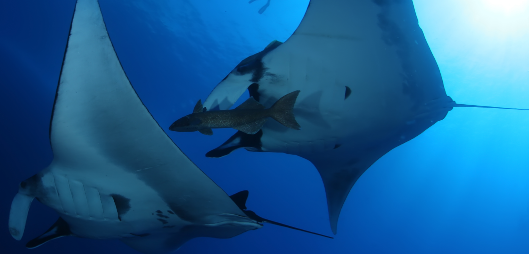
Mantarraya ( Mobula birostris ).