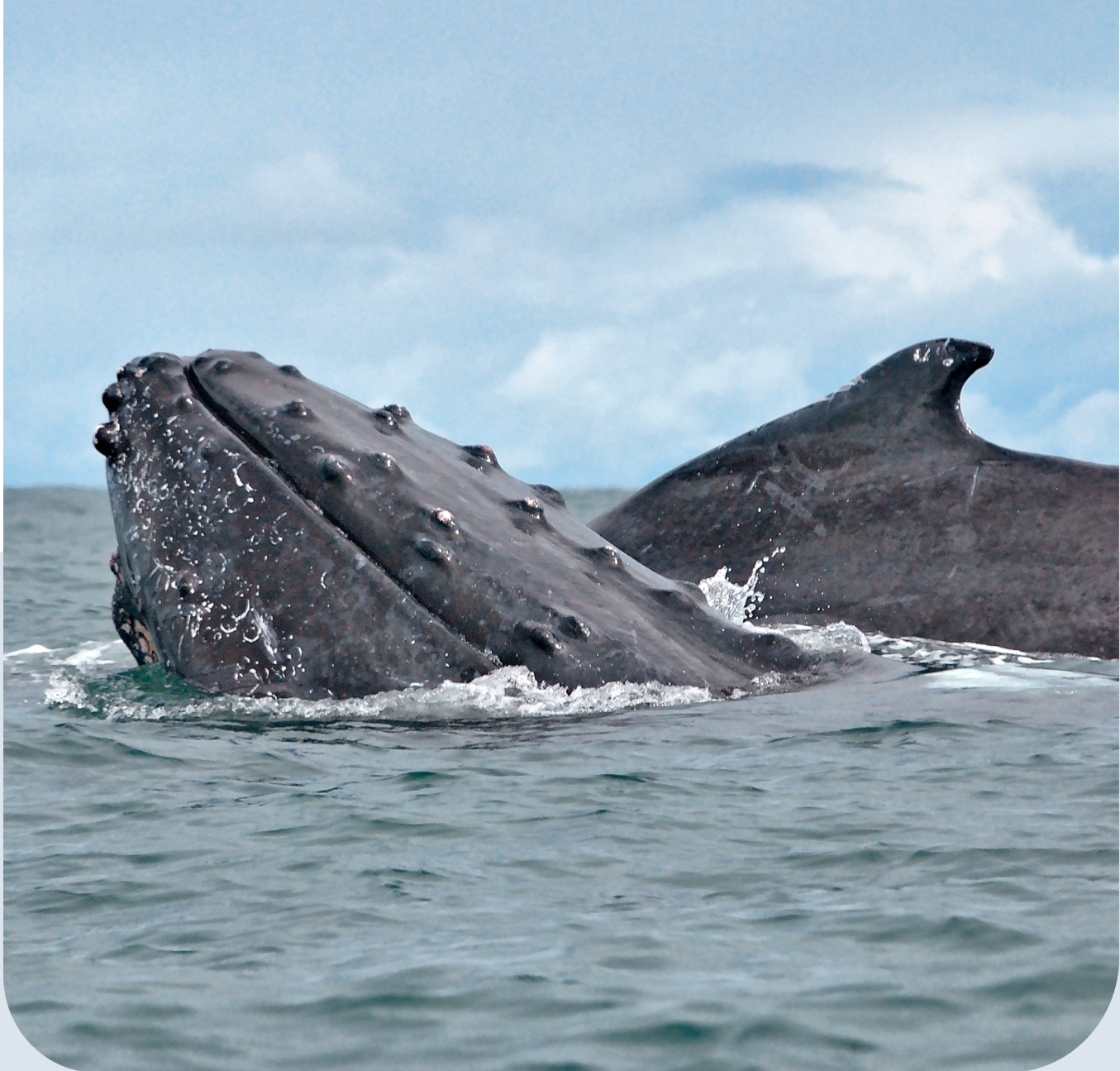
Ballena jorobada ( Megaptera novaeangliae ).