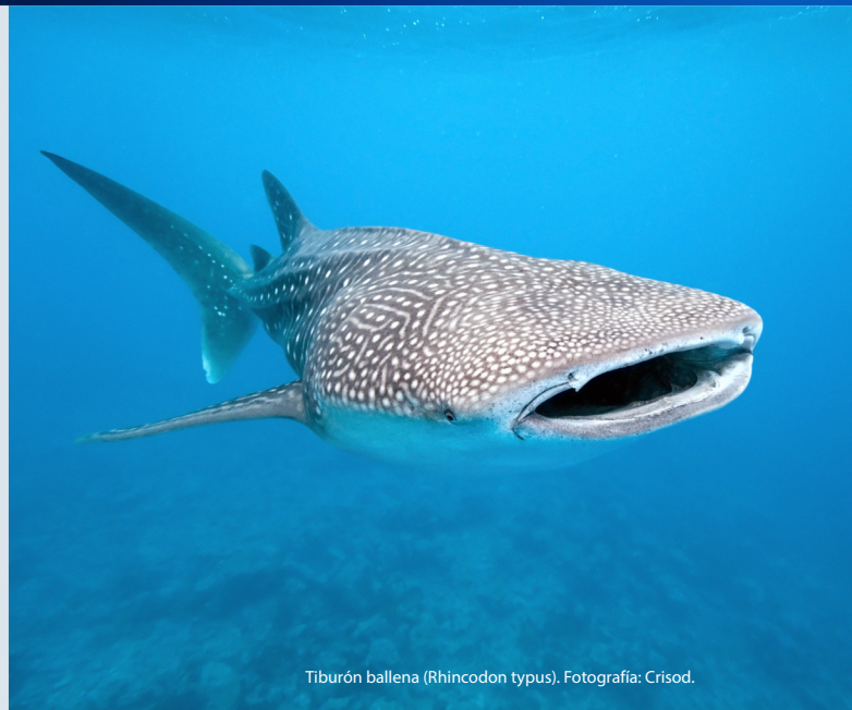
Tiburón ballena ( Rhincodon typus ).

Estrategia regional de comunicación y desarrollo de capacidades: Las principales partes interesadas son conscientes de la importancia de los Blue 5, integran los conocimientos adquiridos en la conservación y la gestión sostenible.