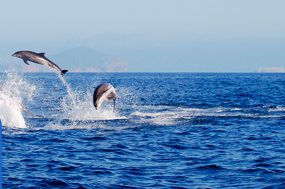
Delfín nariz de botella (Tursiops truncatus).